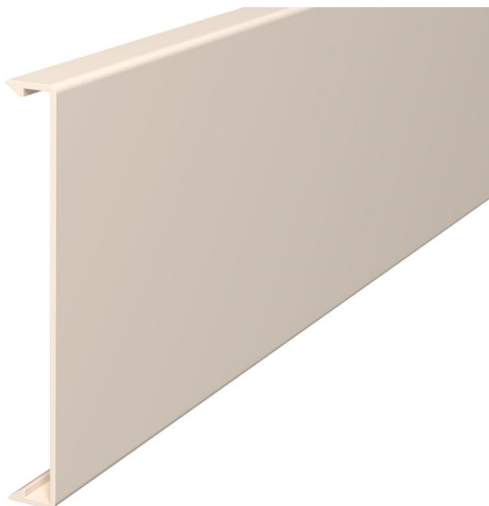
Tampa para fecho das calhas.